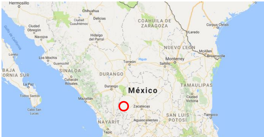
Ubicación del proyecto